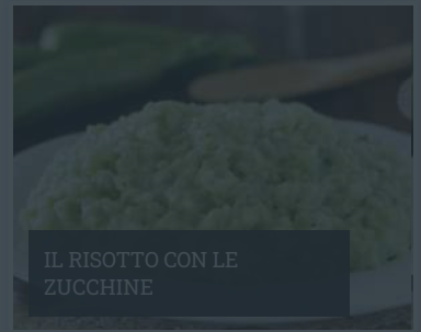
IL RISOTTO CON LE ZUCCHINE