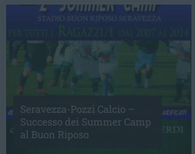
Seravezza-Pozzi Calcio – Successo dei Summer Camp al Buon Riposo