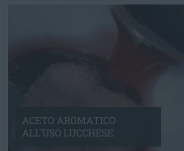
ACETO AROMATICO ALL'USO LUCCHESE.