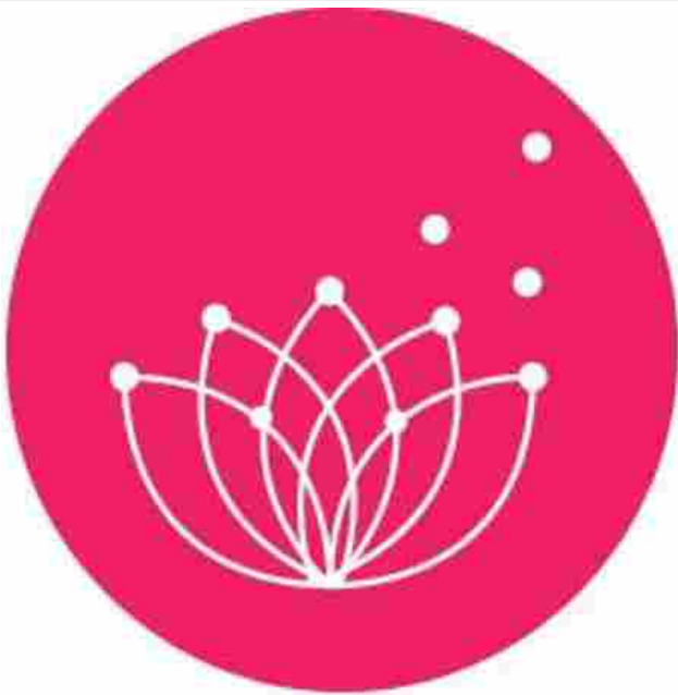
seminario di Primavera d’Impresa