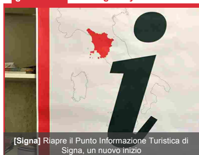
[Signa] Riapre il Punto Informazione Turistica di Signa, un nuovo inizio