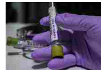
Coronavirus, 9 nuovi casi nell'Aretino. Due i guariti