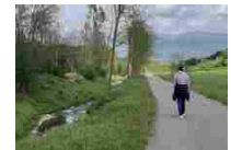
Covid-19 - Fase 2: Stefani, "i nostri fiumi fonte di benessere"