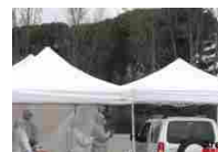
Tamponi mobili: dal 4 maggio attività intensificata