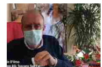
D'Urso a Ghinelli: "pronti a discutere insieme la Fase 2 della..."