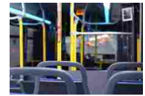
Trasporto pubblico, le nuove disposizioni per la Fase2