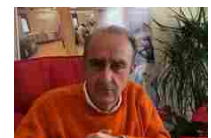
D'Urso: "l'hospice torna nella palazzina Calcic e Siena ha i suoi..."