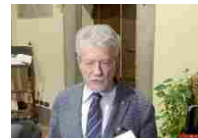
Ghinelli scrive a D'Urso "emergenza Covid: da parte dell'azienda gestione discutibile..."